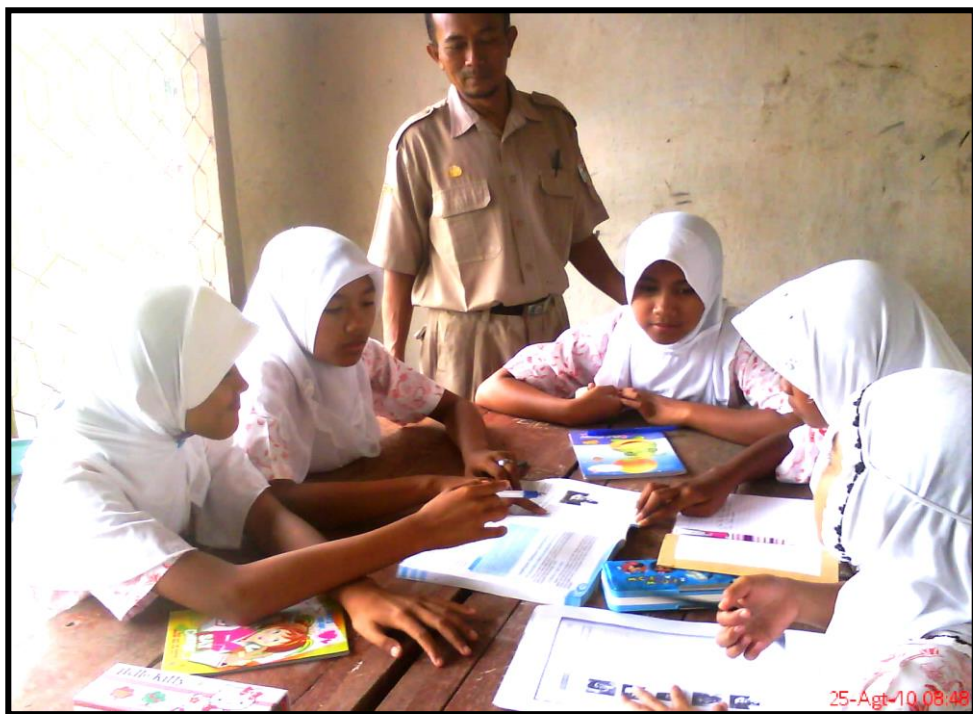
Gambar 2. Kegiatan belajar siswa pada siklus I.